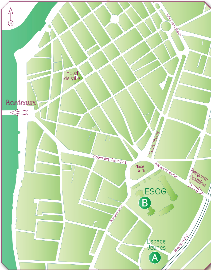
Plan de Libourne